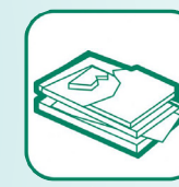
PLÂTRE ET PLAQUES DE PLÂTRE