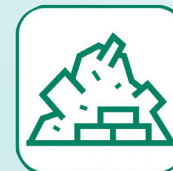
DÉBLAIS / GRAVATS